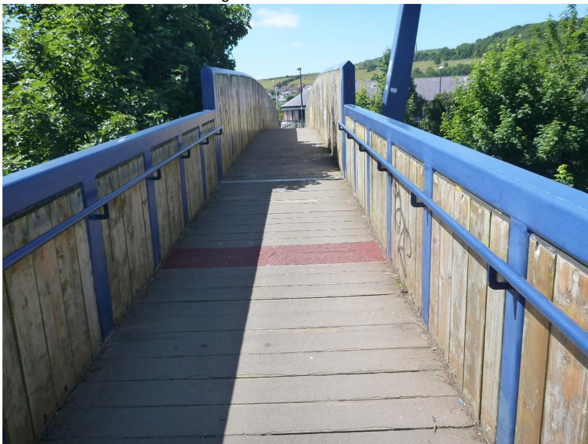
Delwedd 1: Pont Droed Plascrug