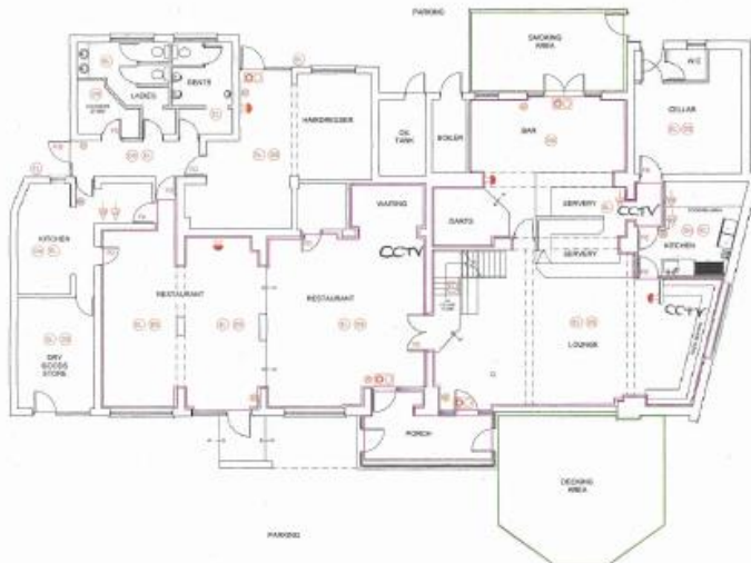
GROUND FLOOR LAYOUT 1:100